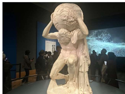
“The days of the United States propping up the entire world order like Atlas are over.” “National Security Strategy 2025”

先に発表された「NSS2025」では、西半球での覇権を最優先事項としたことに加えて、欧州を激しく批判し、見放すような言及があったことがもう一つの注目点だった。移民の増加や保守的な言論への弾圧などにより、 「欧州は文明として消える可能性がある」 とする。また、ロシアに対しては「戦略的安定」が必要だとする。昨年2月14日のミュンヘン安保会議で、ヴァンス氏が欧州首脳の前で言い放った内容とほぼ重なっている。